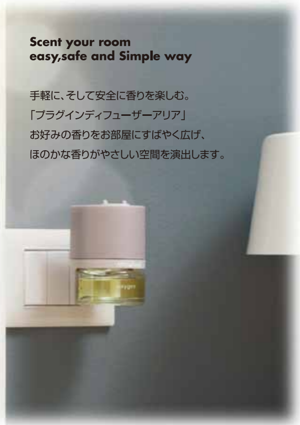
※画像は海外仕様のイメージ写真です。

手軽に、そして安全に香りを楽しむ。 「プラグインディフューザーアリア」 お好みの香りをお部屋にすばやく広げ、 ほのかな香りがやさしい空間を演出します。