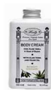
ボディクリーム 300ml 2,500yen+税

荒れやすい肌を健やか柔肌に整えるアロエベラと保湿成分オリーブオイル配合でやさしく泡立ち素肌にやさしいシャワージェル。