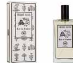
ファーストスノー 1925EPPN

リキュールを思わせるダバナに、クローブやセダー、バニラが絡み合う、懐かしくも重厚感のある香り。