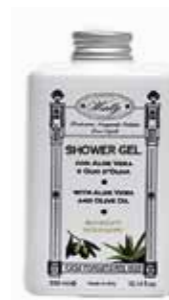
ボディソープ 300ml 2,500yen+税

アロエ&オリーブ シリーズ。 うるおい効果にすぐれたアロエ成分とオリーブオイル天然成分で、しっかりキープしすこやかで美しい肌へ導きます。