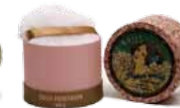
1925TARO イタリアンローズ