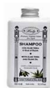
シャンプー 300ml 2,500yen+税

荒れやすい肌を健やか柔肌に整えるアロエベラと保湿成分オリーブオイル配合。肌になめらかに伸び、適度な水分、油分が肌を保護し乾燥、肌荒れを防ぐクリームです。肌にハリとツヤを与え、健やかに保ちます。べとつかずさっぱりとした使用感です。