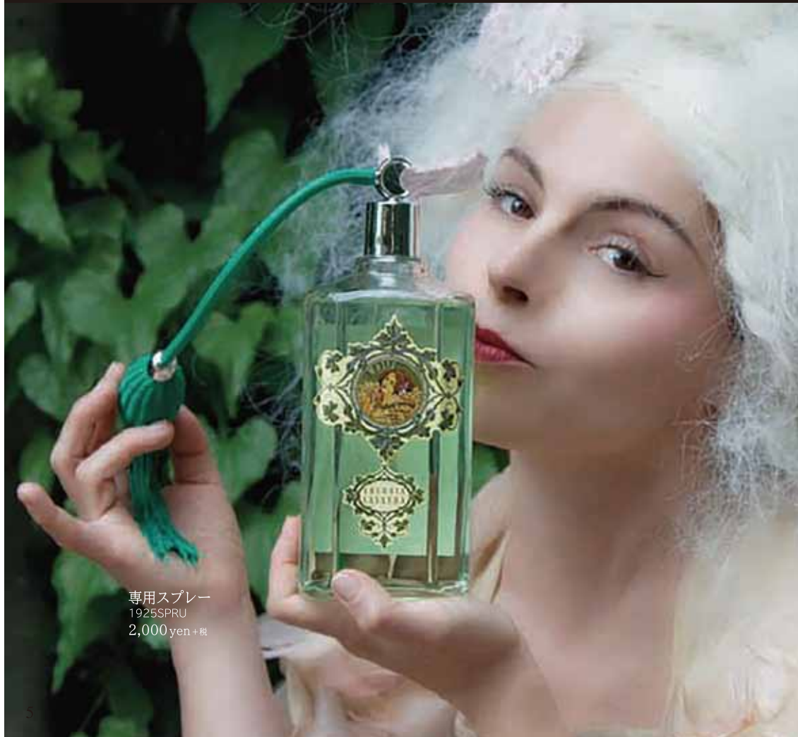
専用スプレー 1925SPRU 2,000yen+税

1925年から製造する手作りのコロンは、ボディやハンカチ、ランジェリーにお使いいただけます。トスカーナの伝統を感じるクラシカルでエレガントな香調とボトルをお楽しみ下さい。