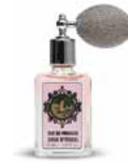
1925ACRO50 イタリアンローズ