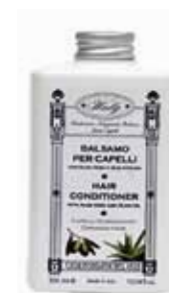
コンディショナー 300ml 2,500yen+税

乾燥しやすい髪の毛を健やかに整えるアロエベラと保湿成分オリーブオイル配合のヘアエッセンスオイル。枝毛になりやすい髪のかたまりとして、アウトバスのヘアトリートメントとしてもお使いいただけます。