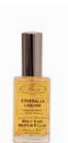
ヘアクリスタルオイル 50ml 3,000yen+税

乾燥しやすい髪の毛を健やかに整えるアロエベラと保湿成分オリーブオイル配合で使い続けることで髪其自然なボリュームと健康を育むシャンプーです。