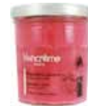
100455 グリオットチェリー ～リスボンの週末～