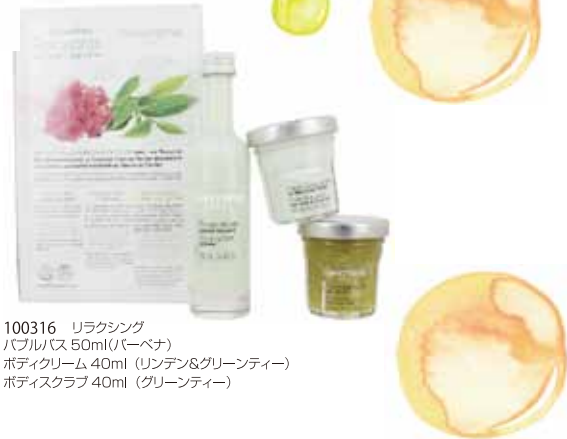
100316 リラクシング バブルバス 50ml(バーベナ) ボディクリーム 40ml (リンデン&グリーンティ) ボディスクラブ 40ml (グリーンティ)