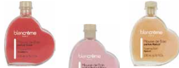
100171 100213 100480 ストロベリー コットンキャンディー アプリコット