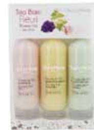
100236 フラワートリオ バブルバス 50ml ローズ / ハニーサックル バーベナ