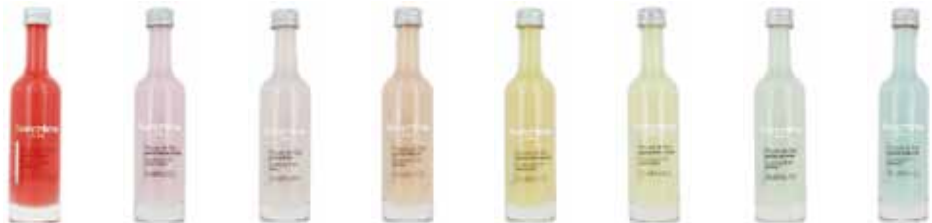
100252 100251 100254 100247 100253 100250 100255 100360 ストロベリー コットンキャンディー ローズ アプリコット ハニーサックル ピナコラーダ バーベナ ルバーブ