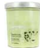
100452 ユスカイビリーニャ ～リオのカクテル～