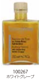
100267 ホワイトグレープ