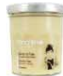
100451 マドレーヌ ～パリのブランチ～