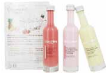
100237 キャンディートリオ バブルバス 50ml ストロベリー / コットンキャンディー ピナコラーダ