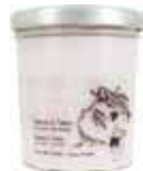
100453 チェリーフラワー ～東京のサクラ～