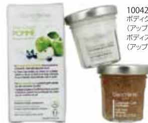
100426 アップル ボディクリーム 40ml (アップル&ブルーベリー) ボディスクラブ 40ml (アップル)