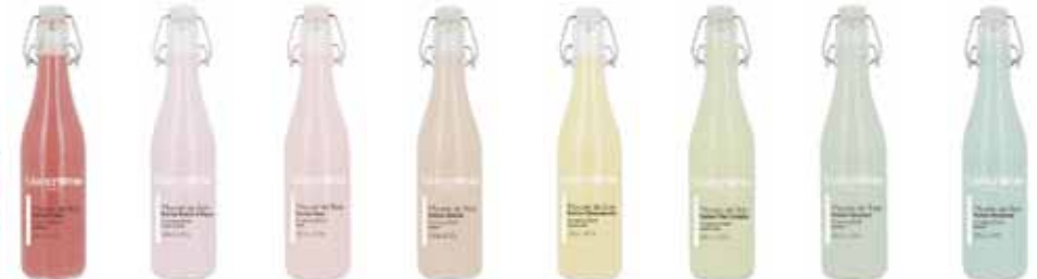
100219 100221 100220 100226 100223 100225 100222 100224 ストロベリー コットンキャンディー ローズ アプリコット ハニーサックル ピナコラーダ バーベナ ルバーブ