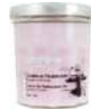
100454 フィグ ～地中海のクルーズ～