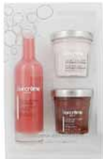
100315 ストロベリー バブルバス 50ml(ストロベリー) ボディクリーム 40ml (ストロベリー&ボメグラネート) ボディスクラブ 40ml (ストロベリー)