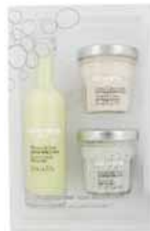
100317 トロピカル バブルバス 50ml(ピナコラーダ) ボディクリーム 40ml (マンゴー&パッション) ボディスクラブ 40ml (ココナッツ)